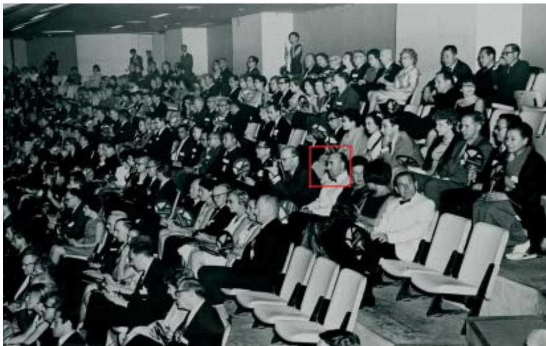
Tokioko Biltzarreko jardunaldi batean, entzule bezala

Nazioarteko biltzarretan aurkezten zituen txostenek edo egindako hitzaldiek eta medikuntza aldizkari berezietan argitaratutako artikuluek kopuru zabala osotzen dute. Bilerantzientifikoetara joaten zen gaixotasunekin borrokatzeko zeuden aurrerapen berrienak ezagutzeaz axola hartuta. Asmo berberak eraman zuen bere itaunleku edo kontsulta klinika txiki bat bezala hornitzera: analisi laborategiarekin hasi zen; gero, X izpietarako tresna bat jarri zuen, orduan aurreratuenetakoa. Ezartzeak lan eta eginketa bereziak behar izan zituen: lehendabizi, solairua indartu burdina eta hormigoiarekin, etxaurreko horma eta oholtza batzuk bota sartzeko, eta