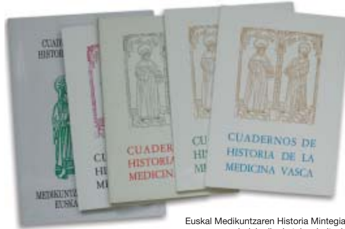
Euskal Medikuntzaren Historia Mintegian egindako ikerketak zabaltzeko argitaratutako aldizkariak, Goti irakasleak zuzenduta

sitako bilketa lanei esker, Granjelen Historia de la Medicina Vasca kaleratu zen. Era berean, lizentziaturako tesitxoak eta doktore tesiak zurrustaka hasi ziren. Aipatzekoa da Mintegiaren eginkizun zientifikoari adierazpen bi-dea emateko eta zabaltzeko Cuadernos de Historia de la Medicina Vasca aldizkaria anto-