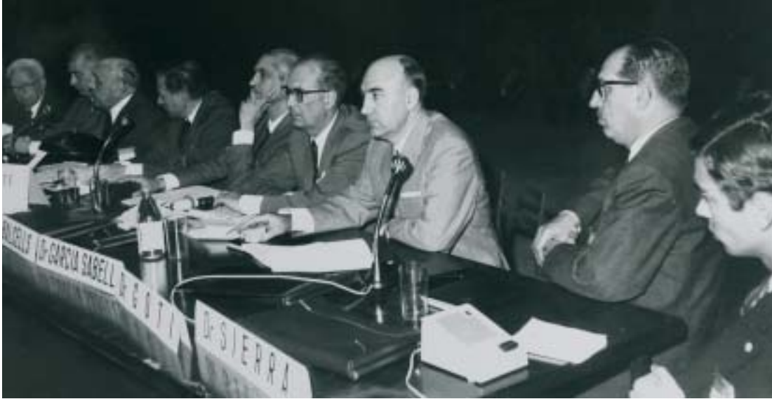
Aparatu digestiboari buruzko gaixotasunei buruzko Biltzar bateko lehendakaritza-mahaian