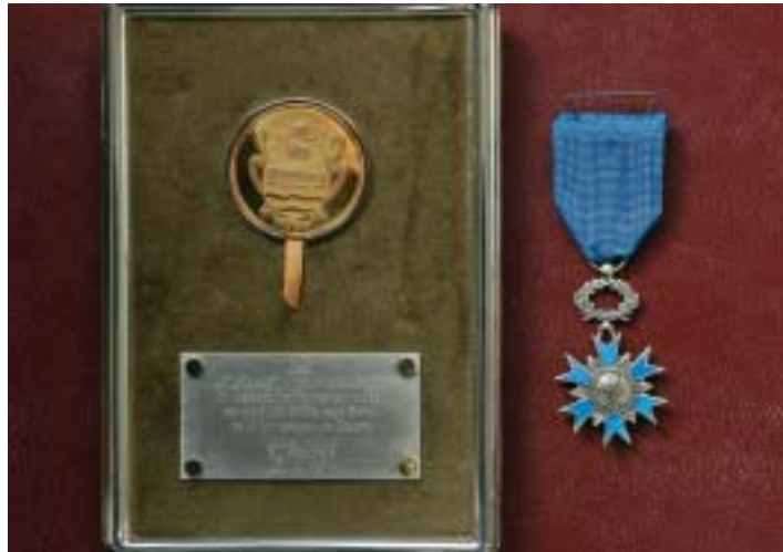
Chevalier du l'Ordre National du Mérite bezala zintzilikatze domina urdin-urdina. Ezkerrekoak, Deustuko Unibertsitateko Patronatuko kidea izan zela adierazten du