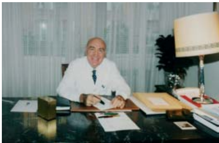
Gaixo batek aurkitzen zuen Goti doktorearen lehen irudia. Unibertsitateko ikasleei azpimarratzen ziren hobe zutela ikasketak lagatzea gogo onekoak ez baziren

Baina arlo akademikoan zabalduko lan honen ez zuen bere kontsultatik edo itaunlektik eta bere gaixoengandik urrunduz. Bere bizitzako azken egunera arte jardun zuen lanean, bat-batean hil baitzen 1998ko urtarriaren 15ean. Ia 50 urtetan, 47.000 pertsona baino gehiago jarri ziren bere zaintzapean.