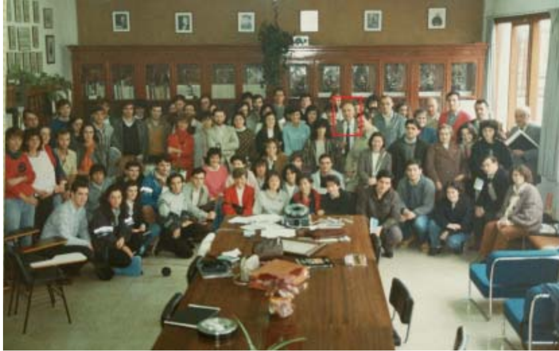
Medikuntzaren Historiako VI. Ikastaroko irakasleak, 1985eko udaberrian, Mintegiaren ikasgelan

ri buruzko Mintegia antolatu zuen. Orduan, dena edo ia dena egiteko zegoen. Euskal Herriko Unibertsitate sortu berriaren erakundetzea geroago egin zen. Baina, astirik galdu gabe, bazihoan edukiak bermarazten: liburutegi bereiztua bildu gune egoki batean, Unibertsitateko agintariengandik lortuta, eta irakaskintzetarako gela Leioako campus berrian. 1981eko lotazilean edo abenduan bazeuden 1.471 liburu, pertsona ezberdinek emanda.