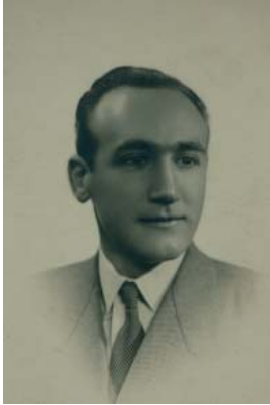
Unibertsitateko ikaslea zen garaiari