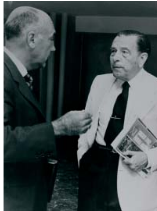
Goti eta Mogeno doktoreak hitz egiten Biltzarraren ekitaldien artean