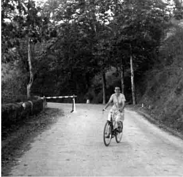
lñaxi txirringan ibiltzen ikasi zuen egunean

atzera-aurrera ez ote zuten egin txirrilaren atzetik!!!