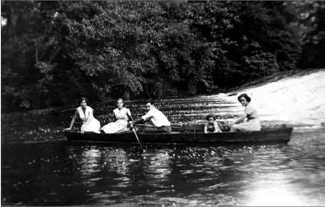
Etxe ondoko Urola ibaian txanelean anaia eta bi lagunekin, eta etxeke ilobarekin «pasiatzen»