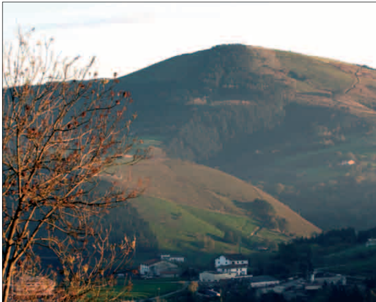
Indamendi Artaditik ikusita