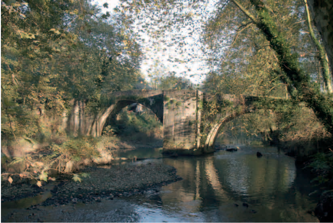
Soutzetik 50 metrora dagoen zubipe honek ez zuen oraintxe ikasi izango angulen berri!