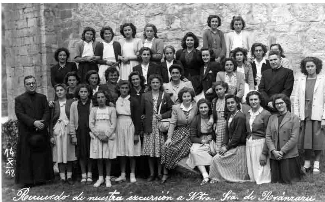
Arantzazura eskurtsioan joandako batean ateratako argazkia

Jendaurreko lehen saioa San Frantziskoren hirugarren ordenakoen urteko lagunarteko