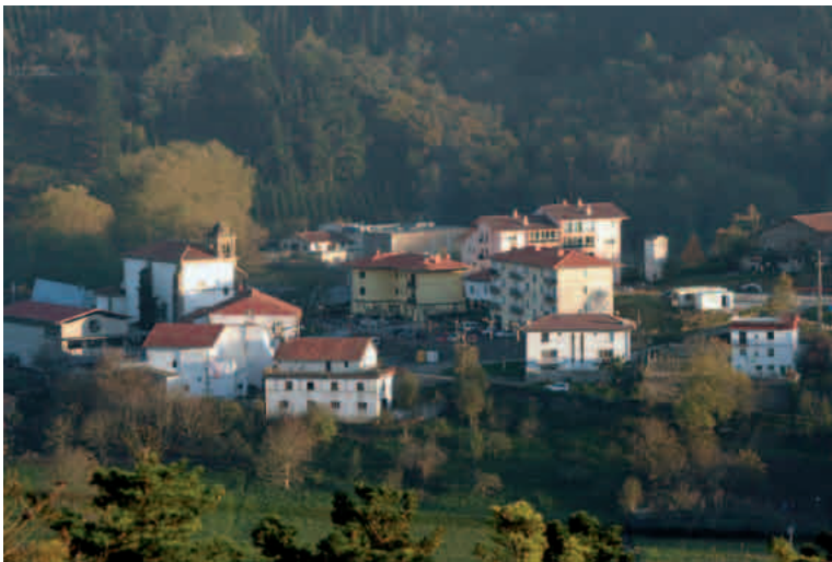
Oikia, Artaditik ikusita

Geroago Donostiara ere joaten omen ziren tren hartuta, traturako jenero asko baldin bazen; tomateak, lekak, sagarrak, misurkak, garaian garaikoak.