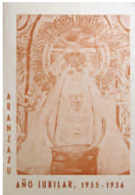
Urte Santuari Arantzazu aldizkariak eskaini zion ale bereziaren gainazala