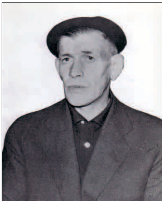
Uztapide 1960ko txapelketan