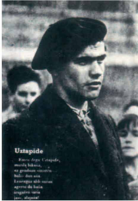
Uztapide Azpeitiko kanporaketan, 1936-I-1