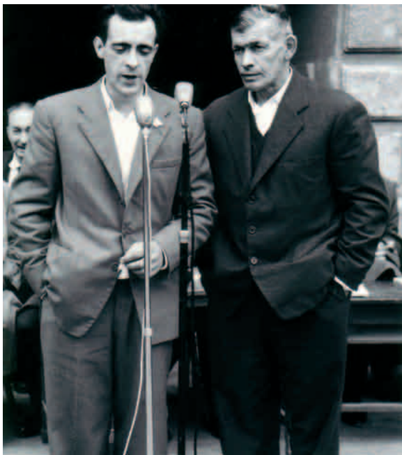
Lasarte eta Uztapide, 1959an

Askotan, batera ematen dira bizitzan eginak eta esanak. Gero, horiek aparteko bizitasuna hartzen dute kontalari on baten ahoan. Eta Uztapide kontalari aparta izan, Antonio Zavalak dioen bezala: «Erriko jendearekin itz asperturik egin badezute, bazkari edo apaldondo batean-edo, aien jarria bukaerarik ez duana dala oartuko ziñaten noski. Baiña bat edo bat beti izaten da gailen agertzen dana. Uztapide zana, adibidez. Ura kontu kontari asten zanean, maai guztia ixildu egiten zan ari entzutearren» ( Auspoaren auspoa II: 239 or. ).