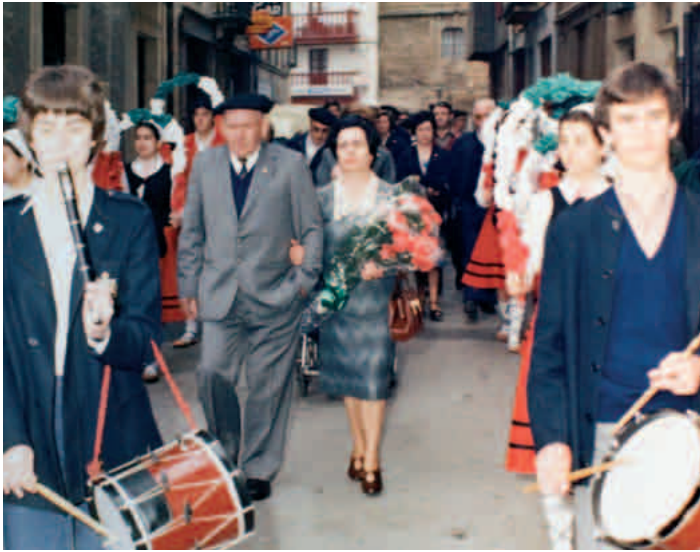
Zarauzko omenaldian, emaztearekin

Lengo egunak gogoan honen ondoren, «era ontako liburu-zerrenda luzea agertuko da, dantza-soka batean bezela», Zavalak dioenez. Zerrenda luze horretan, hirurogei obra badira gutxienez, hogeita hamar idazlek idatziak.