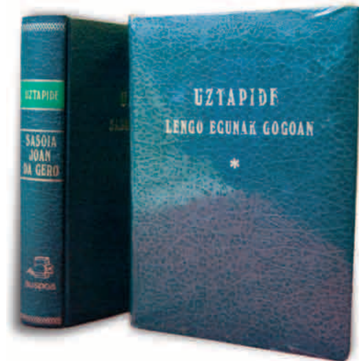
Hitz lau eta bertsotan ondutako bi liburu