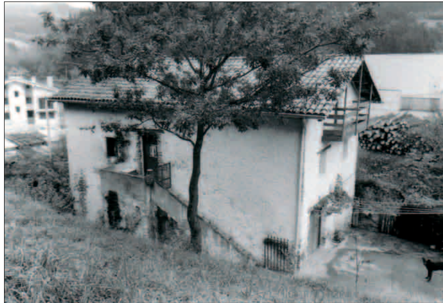
Oartzungo Lagunzarrene baserria