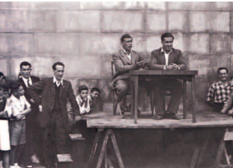
Uztapide eta Basarri