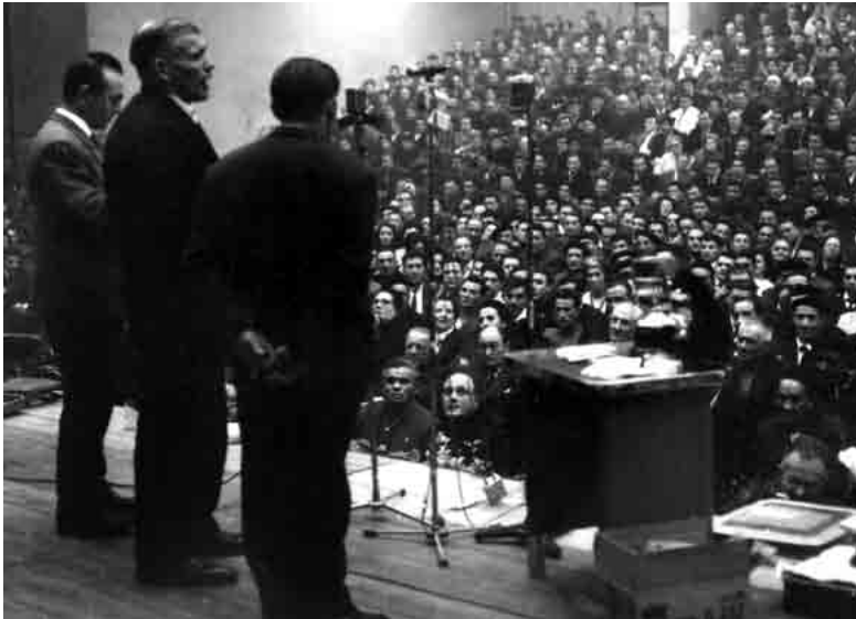
Uztapide frontoia bete entzulez, 1965ean

Nolabai ere udaberrian sortu oi dirade susak, oiek dirade nundik datozen jakiten ez diran gauzak. Igarri ezkerro bat ala ziur bildu bearrean jentuzak, gero argatik sortzen zaizkigu olako Niño Jesusak.»