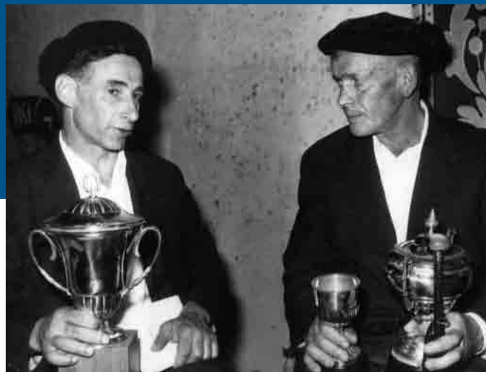
Xalbador eta Uztapide, bi lagun buruz buru, 1967-VI-11 txapelketan

Bertsolari esatean, izateko modu bat ere esaten da, gizaki mota bat, ezaugarri jakin batzuk dituena oro har. Horregatik, bertsolari guztiei aitor dakieke, hein handi batean, Juan Mari Lekuonak jendaurreko bertsolari