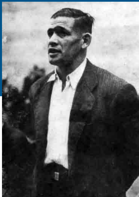
Tolosako txapelketan, 1945ean

Uztapidez, aurkezpen orokor hau egingo du Xabier Euzkitzek, Manuel La-