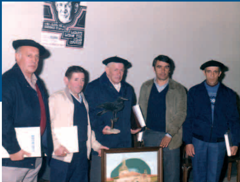
Lizaso, Lazkao-Txiki, Uztapide, Lopategi, Lasarte, 1981-11

Bertsolari eskolatu zen Uztapide, bai, baina betiere esanahi zabal horretan hartuta eskolatu hitza eta kontuan izanik «nahiko zaila dela bereiztea nortzuk diren sail batekoak eta nortzuk bestekoak, batez ere azken urteotako bertsolariez ari garela. Gauza nabaria da —komunikabideak direla medio, eskolak direla eta abar—, gaurrengungo bertsolariak kultura idatziaren giroan bizi direla gehienak».