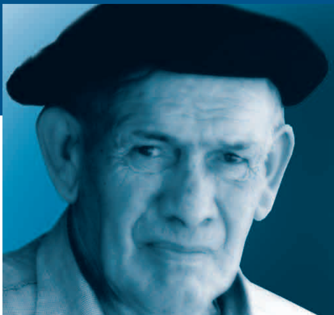
Manuel Olaizola Uztapide (1909-1983)

M anuel Olaizola Urbieto, Uztapide bertsolaria, gaztetan hasi zen bertsoan. Eta II. Bertsolari Egunean parte hartu zuen, 1936an. Gerra ondoren, berak berpiztuko du bertsoaritza, Basarriekin batera, plazaz plaza kantatuz. Euskaltzaindiak antolatutako bertsolari-txapelketetan parte hartu zuen 1960an, 1962an, 1964-1965ean eta 1967an; eta txapeldun irten zen azken hiru hauetan. Lehen liburua, Noizbait , ia osorik bat-bateko bertsoz ondua, 1964an plazaratu zuen. Ondoeza egin zitzaion 1972an, bertsoan ari zela, eta betiko utzi behar izan zuen bat-bateko bertso gintza. Hiru urte geroago, 1975ean, plazaratu zuen Lengo