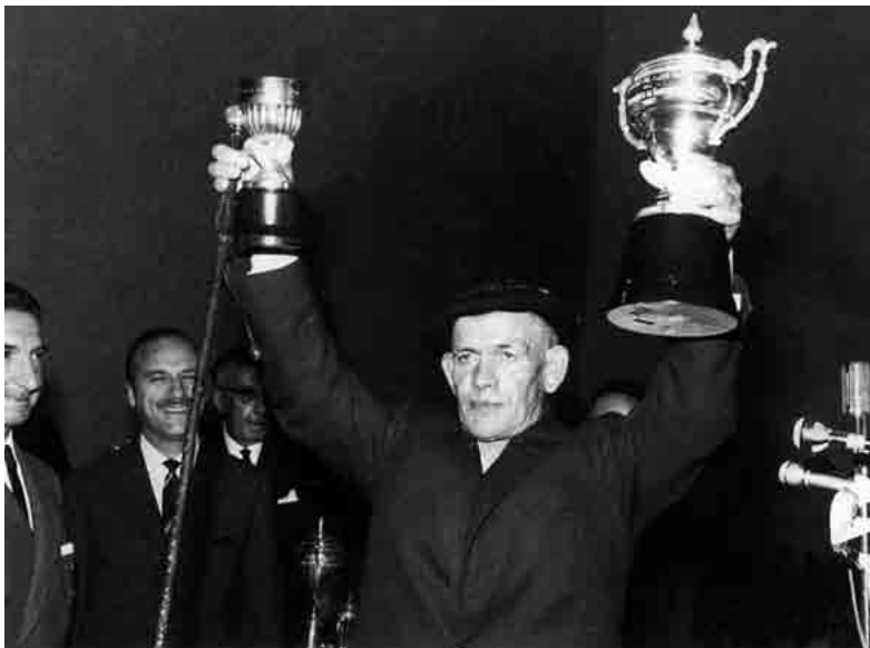
Uztapide txapelduna, sariak eskuetan, jendea agurtzen, 1967-VI-11