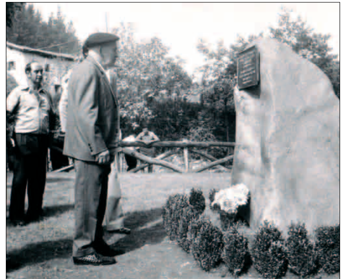
Oiartzunen eskainitako oroitarria, 1975-VIII-8

Oiartzunen hil zen Uztapide, 1983ko ekainaren 8an.