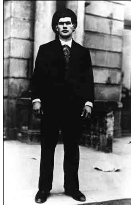
Uztapide 26 urteko gaztea, Donostiako txapelketan, 1936-I-19