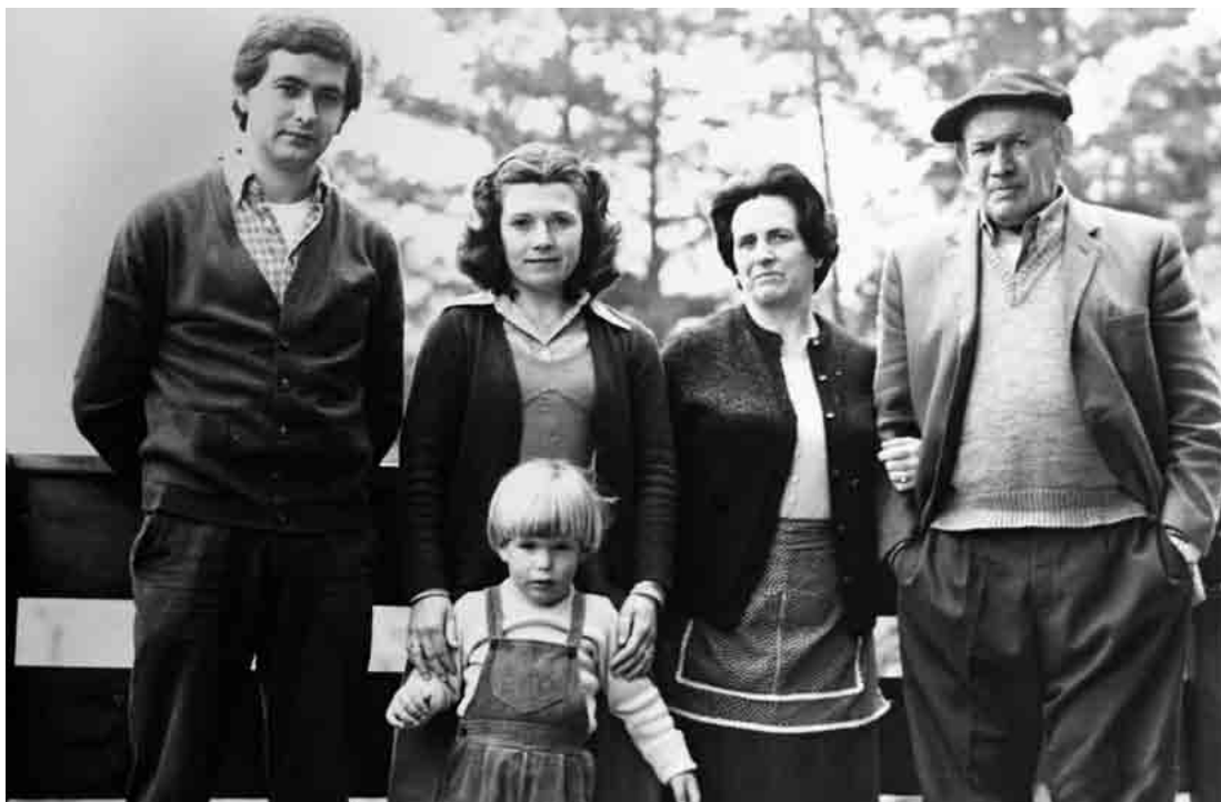
Semea, erraina eta bilobarekin