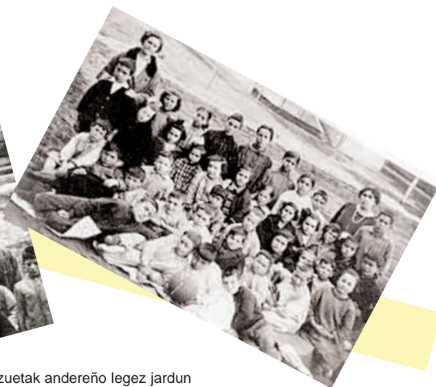
Sorne Unzuetak andereño legez jardun zuen Bizkaiko auzo-eskoletan gerra aurretik.