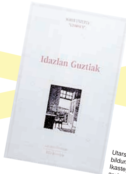
Utarsusen euskal lanen bilduma Labayru Ikastegiak oraintsu argitaratua.