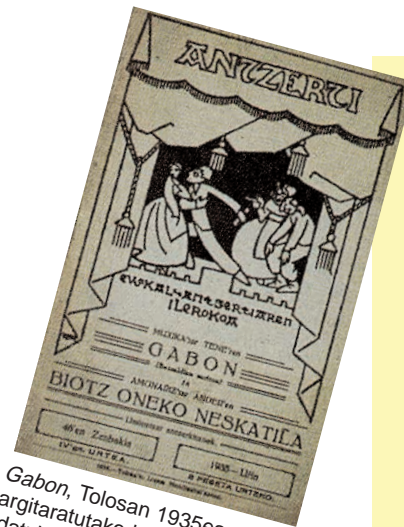
Gabon, Tolosan 1935ean argitaratutako lana. Haurrentzat idatzirik antzerki-obra da.

1931tik aurrera aurreko helburu berari ekingo zaio, hain zuzen, "Jangoikoa eta Lege Zarra" dotrinaren zabalkundeari.