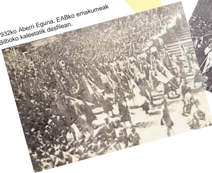
1932ko Aberri Eguna. EABko emakumeak Bilboko kaleetatik desfilean.

Hitzaldi horren ostean, entzule zeuden emakume abertzaleengan eragin zuen gar eta suaren epelean, sortu zuten emakumeok Emakume Abertzale Batza elkarte, honek izango zituen egitamu eta norabide batzuk ere aipatzen zirela.