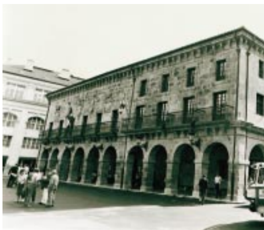
Bergarako Udaletxea, Monzonen hasiera politikan

Idazle egina eta aitortua zen, hala antzerkian nola poesian, prosari ekin zionean. Emanak zeuzkan, itxuraz, bere bulkoak eskatzen zizkion ixuriak. Ez zen beraz literato frustratu bat parabolak idazten zituen politikari hau. Genero honetarako zeukan zaletasunak, nik uste, haren intelektualkeria ezean du oinarri. Jakinduria kultura bilakatu ahal izan dutenen dohain garesti horrekin beti mesprezatu izan zuen pedanteria,