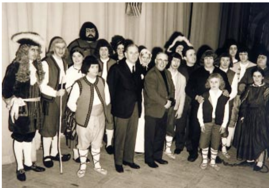
Matalas antzeztu zuen taldea Monzon zuzendariarekin eta Larzabal egilearekin

Belaunaldi berriek ohore handian hartu zuten politikari zaharra, eta behialako jelkidea ezker abertzaleko mitinetan berriro zituen entzuleak liluratzeko dohainak. Herri Batasuneko sortzaileetarikoa izan zen, eta koalizio horretako buruzagi legez atxilotu zuen poliziak 1979an, eta Langraitzen espetxeratu, terrorismoaren apologia egin zuelakoan. Gose grebari ekin zion hemen, eta hiltzeko arriskuan egon zen: 74 urte zituen eta osasun makala. Espetxean zegoelarik diputatu hautatua izan zen Herri Batasunako ordezkari moduan, baina ez zuen inoiz hemizikloa zapaldu.