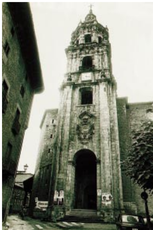
Begarako elizaren ondoan Olaso jauregia