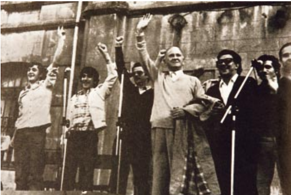
Estrainatuekin itzuli zenean, Durangon

Sei mila euskaldun baziran erdaldunekin batean zorigaitz antza, neke ta gose zutela agerian. Begi larri, egonean, arantza-burdin atzean... Andra ta seme galdu zituzten gehienak bidean.