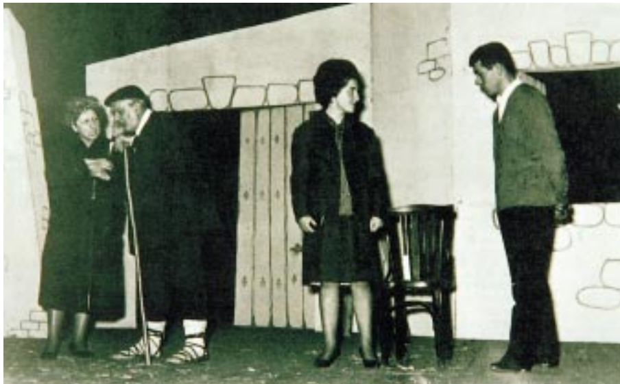
Zurgin Zaharra antzezten