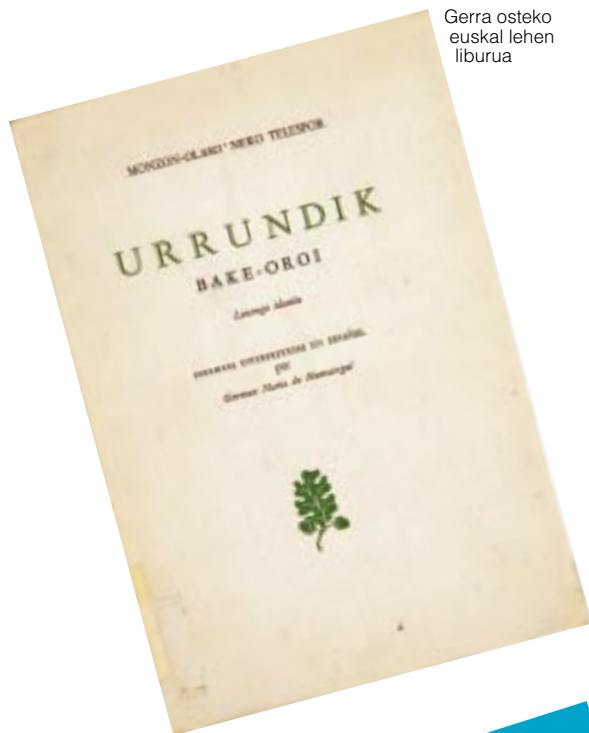
Gerra osteko euskal lehen liburua