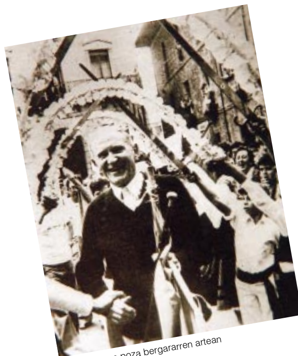
Begararraren poza bergararren artean