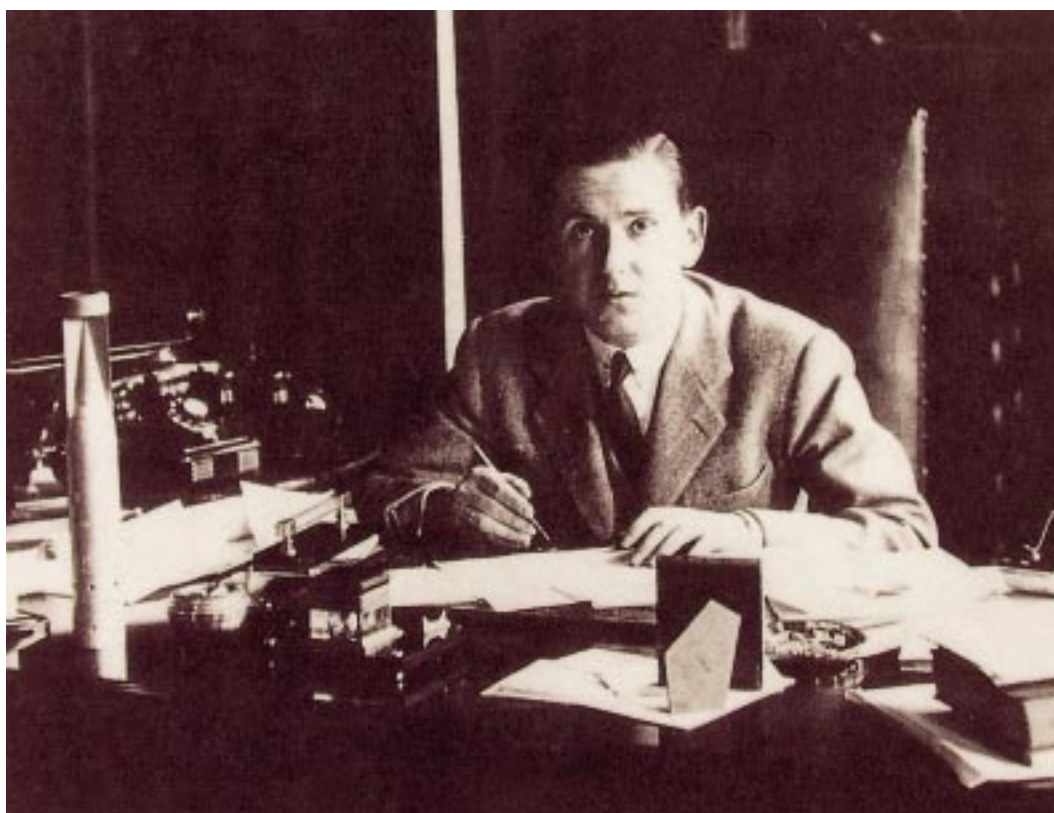
Politikaren alderdi burokratikoak