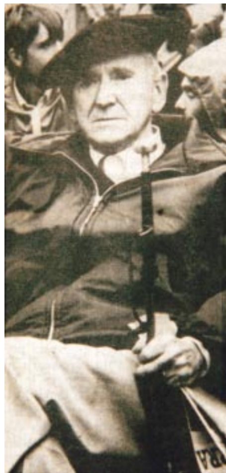
Aristokrataren makila, baserritarren txapela