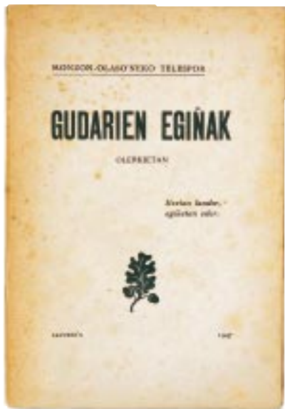
Urrundik-en herrimaren lirika, Gudarien Egiñak -en gerraren epika