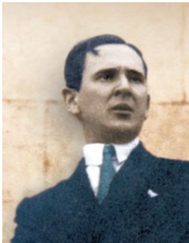
Telesforo Monzon, 1904-1981

zenbait ola berri ere sortu direla, bergararren elkarganako anaigoak ez du arlotekeria usainik. Sorterriari dakarkiogun maitasunak biltzen bide gaitu elkarrekin.» Bergarartasun demokratiko hau bere ibilbide politiko-kulturalaren isla dela esan liteke, herri xehearenganako, hizkuntzarenganako