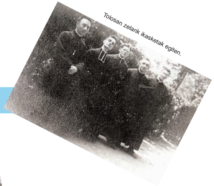
Tolosan zelarik ikasketak egiten.