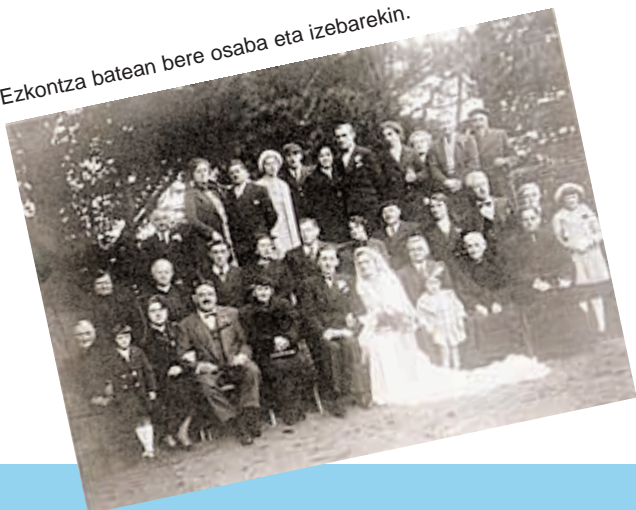
Ezkontza batean bere osaba eta izebarekin.