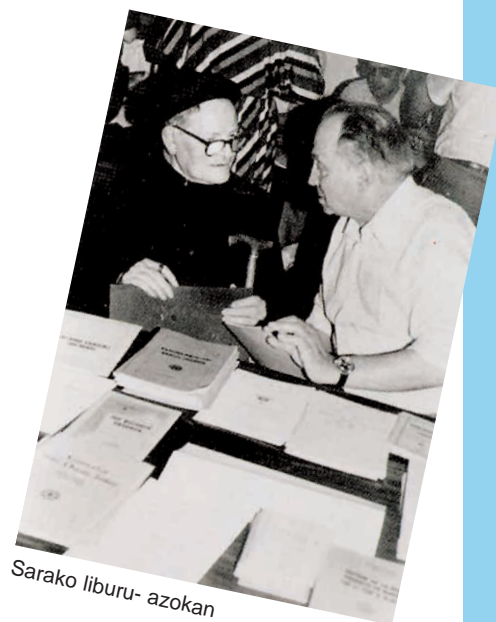
Sarako liburu- azokan

Herria beti bizi da 53 urteren buruan eta 4.000 ale saltzen ditu iparralde ttiki honetan.