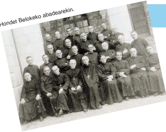
Hondet Belokeko abadearekin.