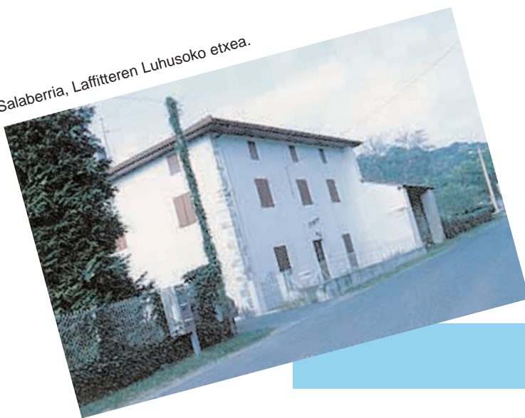
Salaberria, Laffitteren Luhusoko etxea.

1919an, gerla ondoko lehen hauteskundeak izan baitziren, Le Courier astekarian, dena gatz eta biper, kontatu zuen nola iragan zen Uztaritzen Garat gorriaren mitina. Frantsesez. Artikulua gustatu zitzaion zuzendariari, eta honek eskaturik segitu zuen artikuluak idazten... izenpetu gabe -apezgaiek kazetak irakurtzeko eskubiderik ez, eta are gutxiago kazetetan idaztekoa-